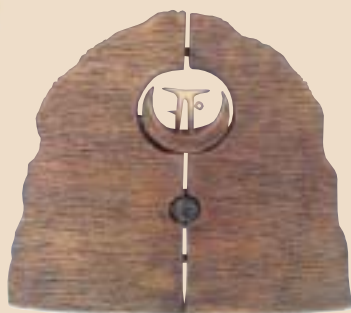
「合2—生」— 陰陽兩性之合才能造就宇宙生命之無限延續。(吳金象提供)