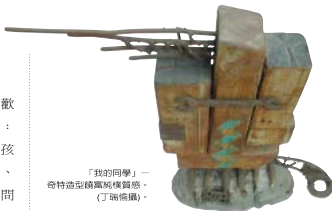
「我的同學」— 奇特造型饒富純樸質感。 (丁瑞拍攝)。

地工作，可以說是十分自由自在地成長，也沒像現在的孩子一樣得到諸多的栽培，但倒是有一個畫畫的啓蒙老師，就是他的舅公。他說：「由於舅公是專門畫山水油畫、花鳥畫等掛畫、裝飾畫的畫者，畫技十分出色，所以我小時候十分崇拜他，常自己坐公車到天母去看他畫畫、跟他聊天。或許，在不知不覺中也學到了一些畫畫的技巧。」