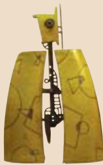
「佇視」— 佇立而視即可窺見萬物之至理。

二、基礎功夫一定要扎實，美術的基本能力養成非常重要，它攸關將來對作品結構與美感的掌握能力。