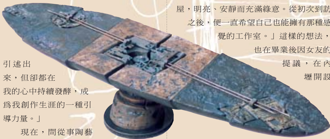
「悠」— 以扁葉造型隱喻穿梭世間的靜穆。

「集陶美術陶藝教室」教小朋友畫畫、捏陶，而自己則在退伍後，基於給長輩放心的想法，先到中壢國中任教，婚後才在太太的全力支持下，專心投入陶藝創作之路。